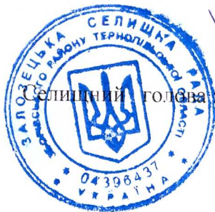
Д. І. Фесик