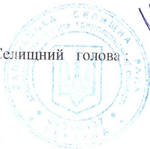
Л. І. Фесик